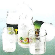
Pots et bocaux en verre