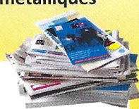
Papiers, journaux, magazines