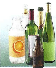
Bouteilles en verre