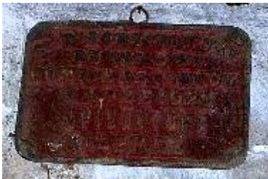
Société d'Agriculture du Gers et Comice de Condom Eauze 1922 Apiculture 1er Prix