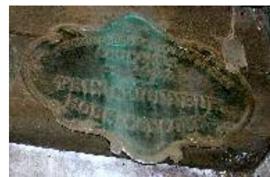
S té d'Encouragement à l'Ag re du Gers Concours de 1923 Prix d'Honneur Hors Concours