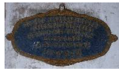
Société d'Encouragement à l'Agriculture du Gers Exposition Agricole Auch 1921 - Apiculture 1er Prix