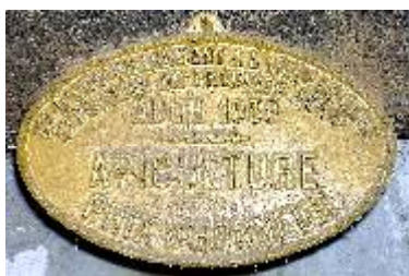
S te d'Encouragement à l'Ag re du Gers Exposition de Produits Agricoles Auch 1959 Apiculture Prix d'Honneur