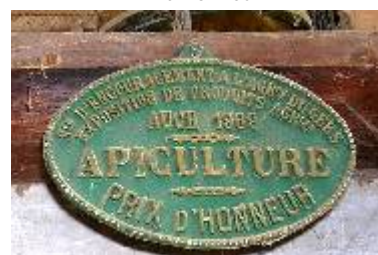
S te d'Encouragement à l'Ag re du Gers Exposition de Produits Agricoles Auch 1969 Apiculture Prix d'Honneur