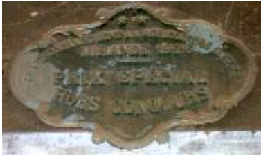
Société d'Encouragement à l'Agriculture du Gers Mirande 1926 Prix Spécial Hors Concours