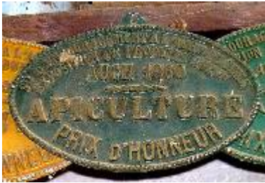
S te d'Encouragement à l'Ag re du Gers Exposition de Produits Agricoles Auch 1960 Apiculture Prix d'Honneur