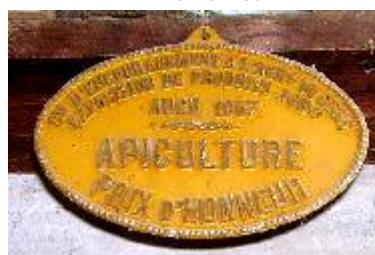
S te d'Encouragement à l'Ag re du Gers Exposition de Produits Agricoles Auch 1957 Apiculture Prix d'Honneur