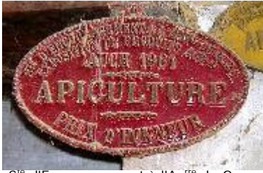
S te d'Encouragement à l'Ag re du Gers Exposition de Produits Agricoles Auch 1961 Apiculture Prix d'Honneur