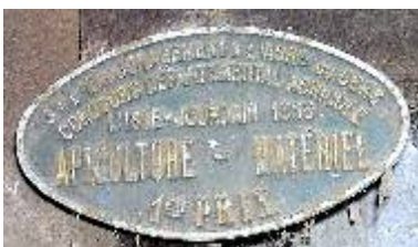
S te d'Encouragement à l'Ag re du Gers Concours départemental Agricole L'Isle-Jourdain 1953 Apiculture - Matériel 1er Prix