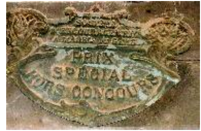
Société d'Encouragement à l'Agriculture du Gers Prix Spécial Hors Concours