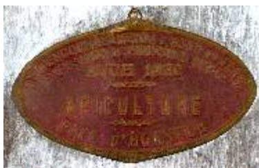
S te d'Encouragement à l'Ag re du Gers Exposition de Produits Agricoles Auch 1932 Apiculture Prix d'Honneur