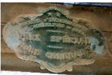
Société d'Encouragement à l'Agriculture du Gers Prix Spécial Hors Concours