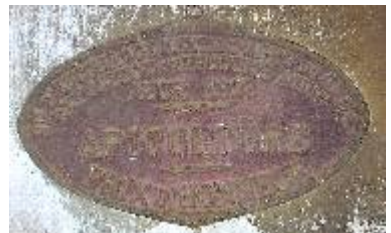
S té d'Encouragement à l'Ag re du Gers Exposition de Produits Agricoles Auch 1928 Apiculture Prix d'Honneur