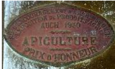
S té d'Encouragement à l'Ag re du Gers Exposition de Produits Agricoles Auch 1930 Apiculture Prix d'Honneur