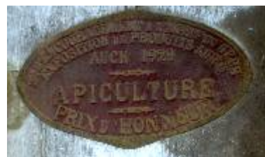
S te d'Encouragement à l'Ag re du Gers Exposition de Produits Agricoles Auch 1929 Apiculture Prix d'Honneur