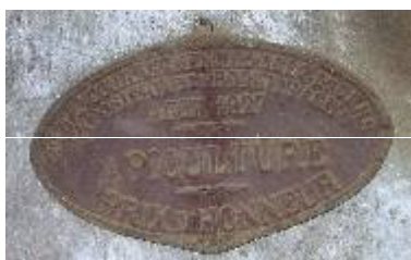
S te d'Encouragement à l'Ag re du Gers Exposition de Produits Agricoles Auch 1927 Apiculture Prix d'Honneur