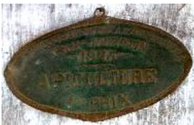
S te d'Encouragement à l'Ag re du Gers L'Isle-Jourdain 1925 Apiculture 1er Prix