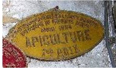
S te d'Encouragement à l'Ag re du Gers Exposition de Produits Agricoles Auch 1954 Apiculture 1er Prix