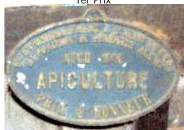
S te d'Encouragement à l'Ag re du Gers Exposition de Produits Agricoles Auch 1952 Apiculture Prix d'Honneur