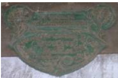
Société d'Agriculture Diplôme & Médaille d'OR Produits Agricoles Concours de Toulouse