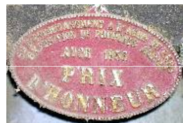
S te d'Encouragement à l'Ag re du Gers Exposition de Produits Agricoles Auch 1953 Prix d'Honneur