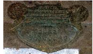
Société d'Encouragement à l'Agriculture du Gers Auch 1922 Hors Concours