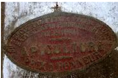
S té d'Encouragement à l'Ag re du Gers Exposition de Produits Agricoles Auch 1931 Apiculture Prix d'Honneur