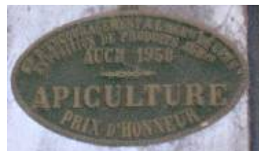
S te d'Encouragement à l'Ag re du Gers Exposition de Produits Agricoles Auch 1958 Apiculture Prix d'Honneur