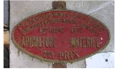
S te d'Encouragement à l'Ag re du Gers Concours Départemental Agricole Lectoure 1955 Apiculture - Matériel 1er Prix