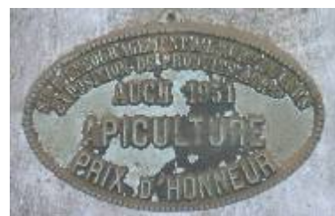
S te d'Encouragement à l'Ag re du Gers Exposition de Produits Agricoles Auch 1951 Apiculture Prix d'Honneur