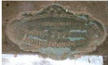
Société d'Encouragement à l'Agriculture du Gers Auch 1928 Prix Spécial Hors Concours