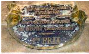
Fédération Régionale d'Apiculture 1922 Exposition Apicole de Niort (Deux Sèvres) 1er Prix