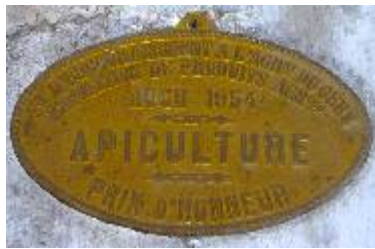
S té d'Encouragement à l'Ag re du Gers Exposition de Produits Agricoles Auch 1954 Apiculture Prix d'Honneur