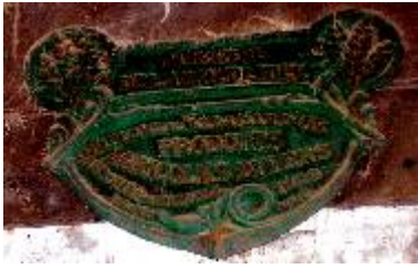
Ministère de l'Agriculture Diplôme de Médaille d'Or Produits Agricoles divers Concours de Toulouse 1900 Auch Paris